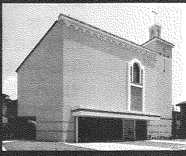
(裏面もお読み下さい。)