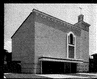
(裏面もお読み下さい。)